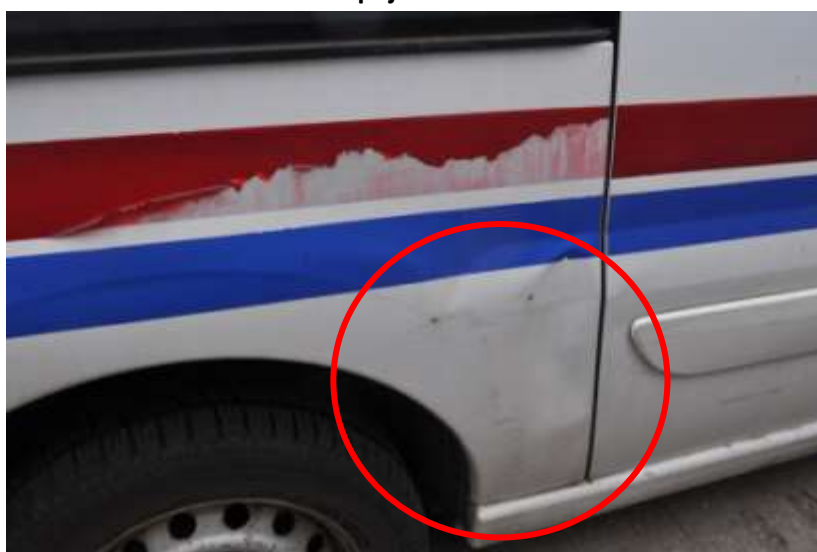
Fot. nr 8. Badania pojazdu – zakres uszkodzeń.