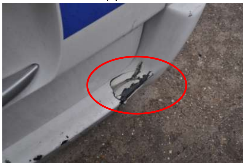
Fot. nr 6. Badania pojazdu – zakres uszkodzeń.

Rzecznawca nr RS001163 ♦ bobrowskistefan@poczta.onet.pl ♦ tel. 602 139 377