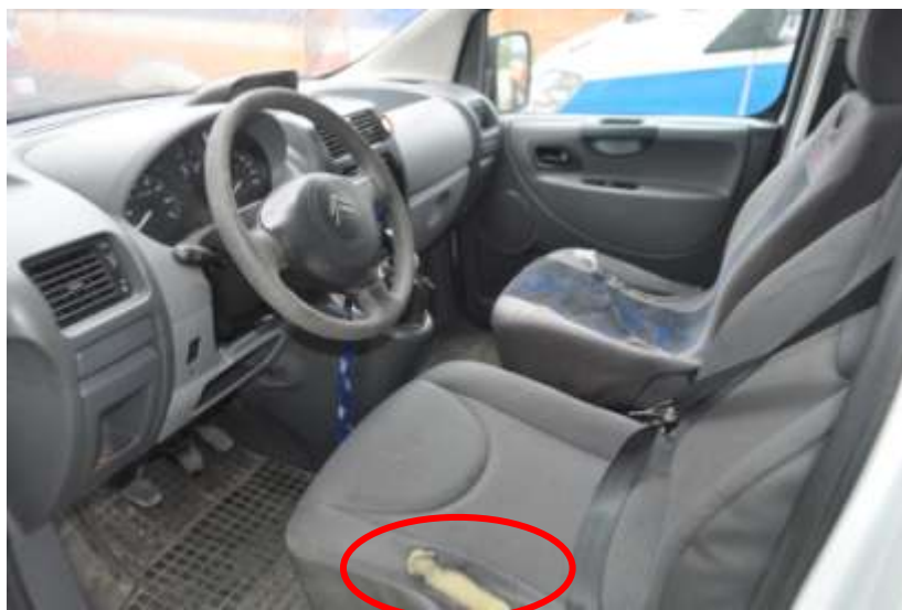
Fot. nr 10. Badania pojazdu – zakres uszkodzeń.