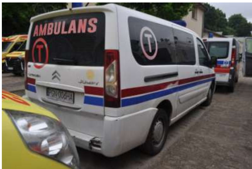
Fot. nr 7. Badania pojazdu – zakres uszkodzeń.