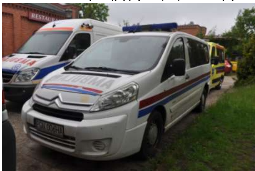
Fot. nr 2. Badania pojazdu – zakres uszkodzeń.