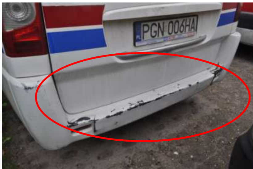
Fot. nr 4. Badania pojazdu – zakres uszkodzeń.