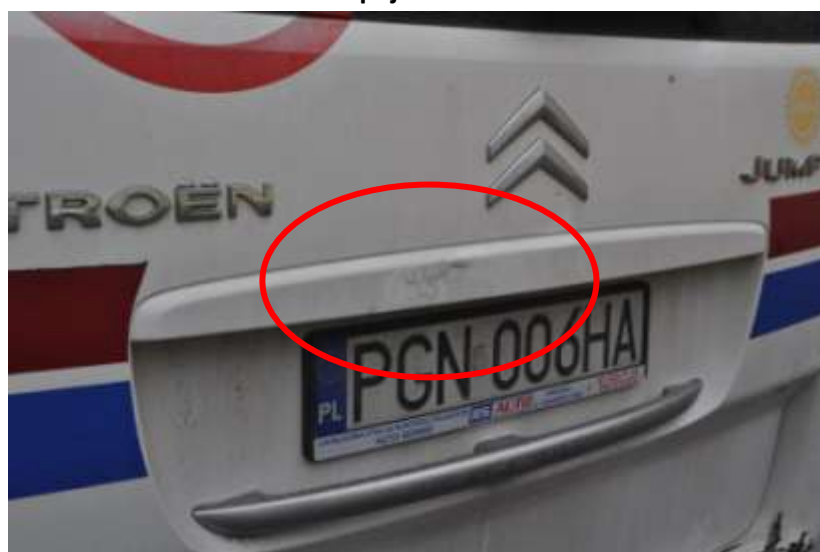
Fot. nr 5. Badania pojazdu – zakres uszkodzeń.