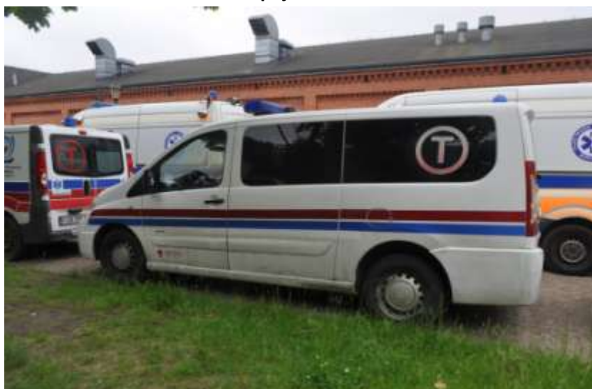
Fot. nr 3. Badania pojazdu – zakres uszkodzeń.

Rzecznawca nr RS001163 ♦ bobrowskistefan@poczta.onet.pl ♦ tel. 602 139 377