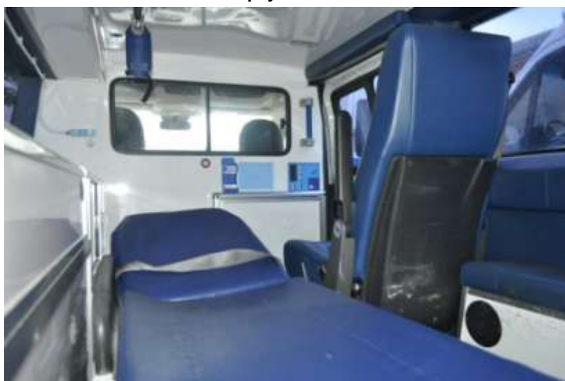
Fot. nr 9. Badania pojazdu – zakres uszkodzeń.

Rzecznawca nr RS001163 ♦ bobrowskistefan@poczta.onet.pl ♦ tel. 602 139 377