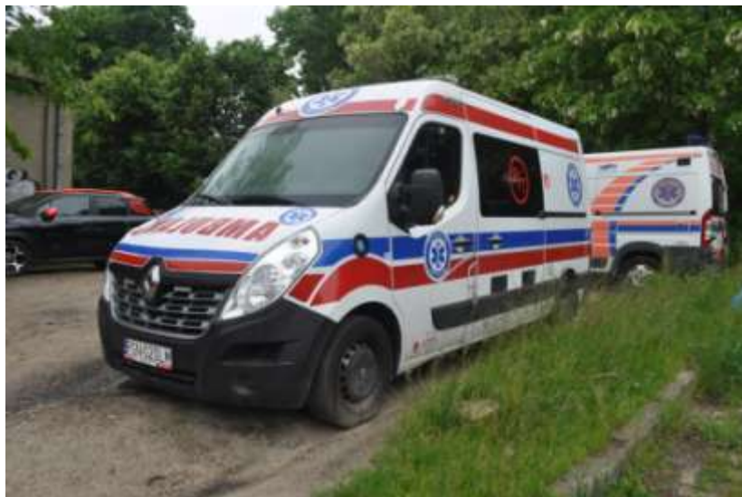
Fot. nr 2. Badania pojazdu – zakres uszkodzeń.