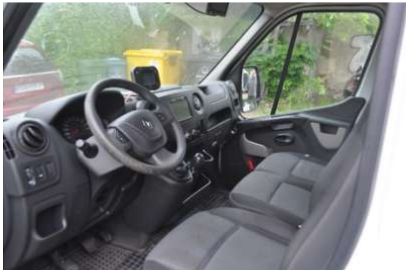
Fot. nr 6. Badania pojazdu – zakres uszkodzeń.

Rzecznawca nr RS001163 ♦ bobrowskistefan@poczta.onet.pl ♦ tel. 602 139 377