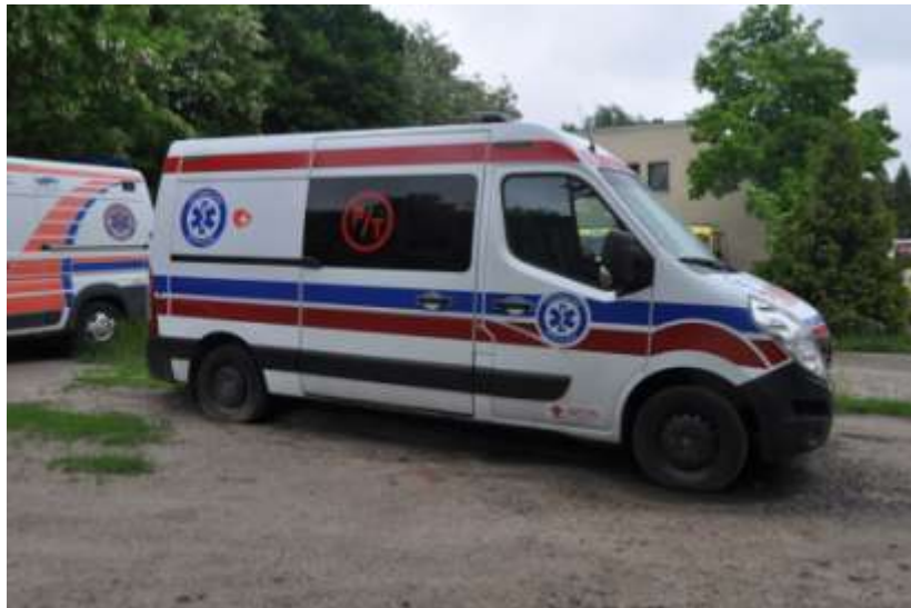
Fot. nr 4. Badania pojazdu – zakres uszkodzeń.