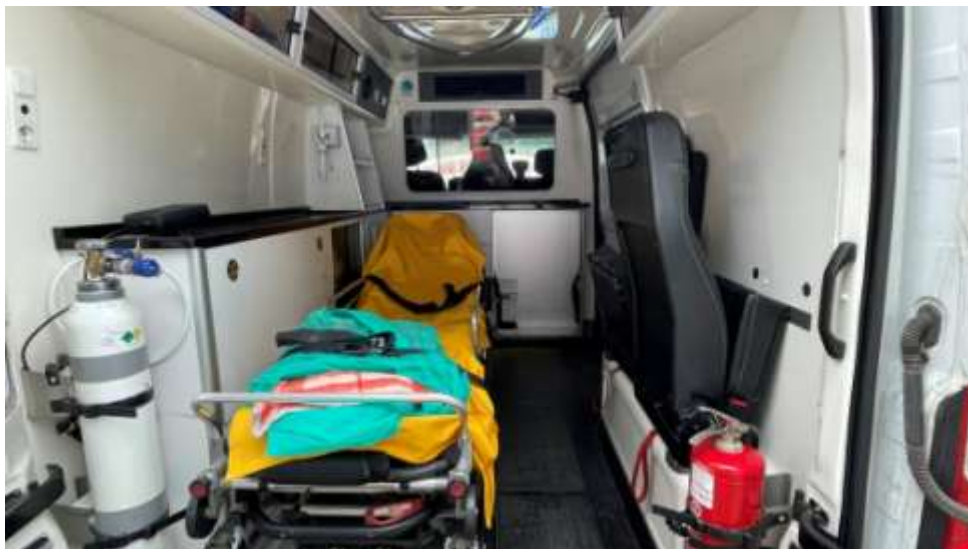
Fot. nr 10. Badania pojazdu – zakres uszkodzeń.