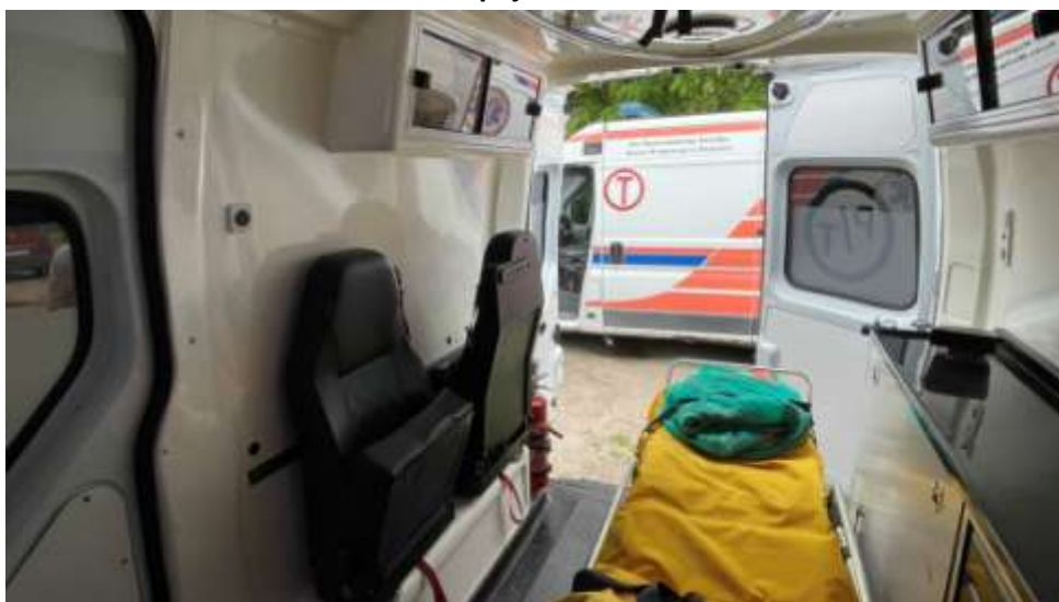
Fot. nr 11. Badania pojazdu – zakres uszkodzeń.