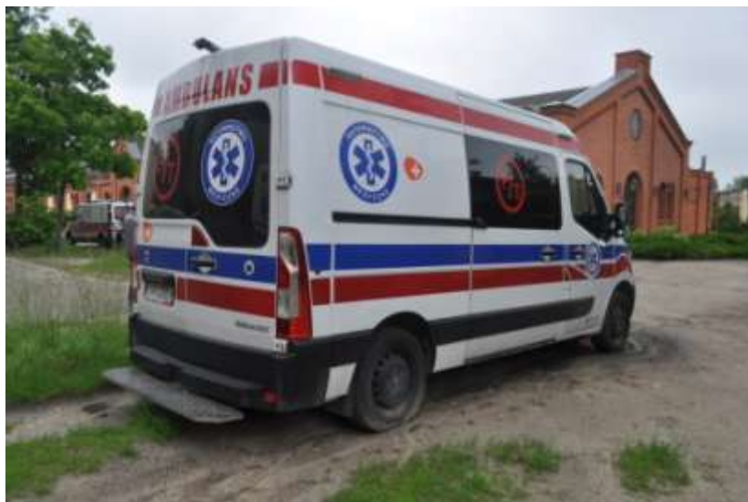
Fot. nr 5. Badania pojazdu – zakres uszkodzeń.