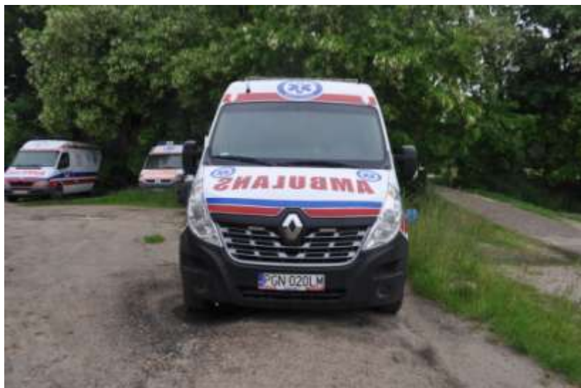
Fot. nr 3. Badania pojazdu – zakres uszkodzeń.

Rzeczoznawca nr RS001163 ♦ bobrowskistefan@poczta.onet.pl ♦ tel. 602 139 377