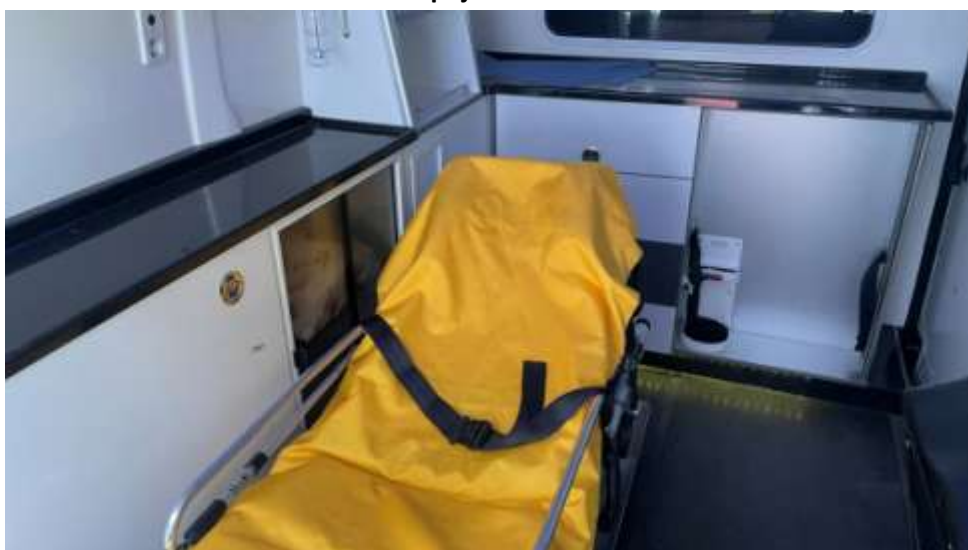
Fot. nr 9. Badania pojazdu – zakres uszkodzeń.

Rzecznawca nr RS001163 ♦ bobrowskistefan@poczta.onet.pl ♦ tel. 602 139 377