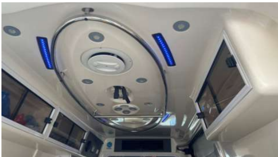
Fot. nr 7. Badania pojazdu – zakres uszkodzeń.