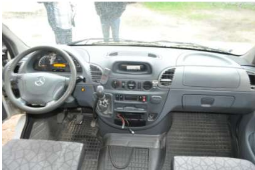
Fot. nr 9. Badania pojazdu – zakres uszkodzeń.

Rzecznawca nr RS001163 ♦ bobrowskistefan@poczta.onet.pl ♦ tel. 602 139 377