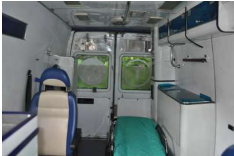
Fot. nr 10. Badania pojazdu – zakres uszkodzeń.