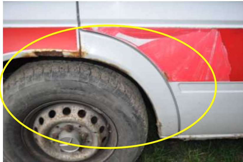
Fot. nr 7. Badania pojazdu – zakres uszkodzeń.