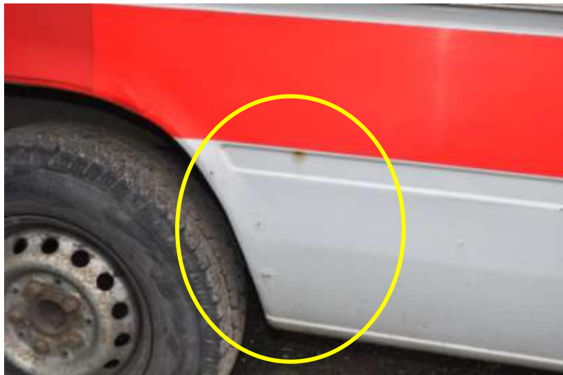
Fot. nr 6. Badania pojazdu – zakres uszkodzeń.

Rzecznawca nr RS001163 ♦ bobrowskistefan@poczta.onet.pl ♦ tel. 602 139 377