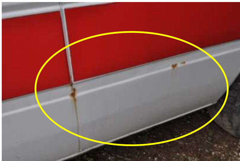
Fot. nr 8. Badania pojazdu – zakres uszkodzeń.