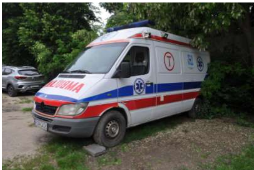
Fot. nr 2. Badania pojazdu – zakres uszkodzeń.