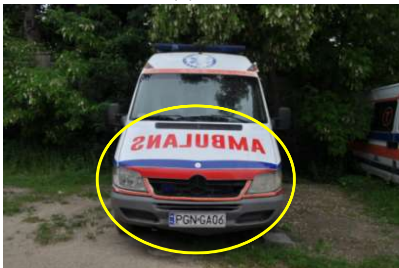
Fot. nr 3. Badania pojazdu – zakres uszkodzeń.