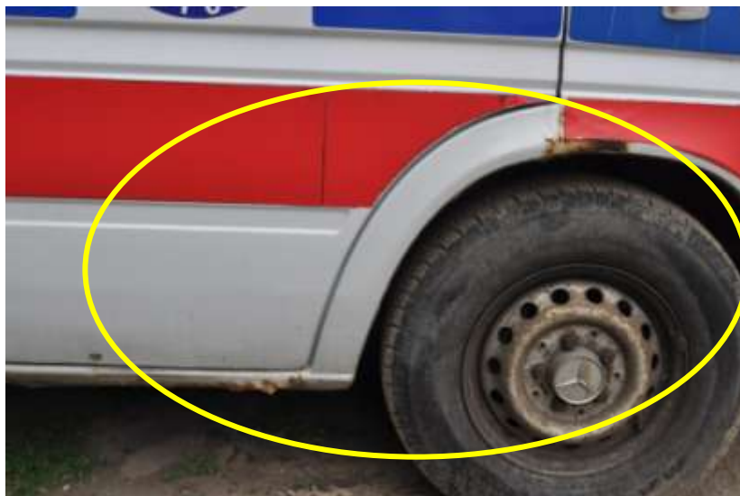
Fot. nr 5. Badania pojazdu – zakres uszkodzeń.