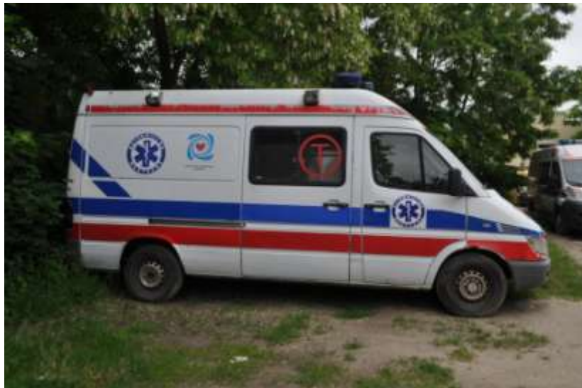
Fot. nr 4. Badania pojazdu – zakres uszkodzeń.